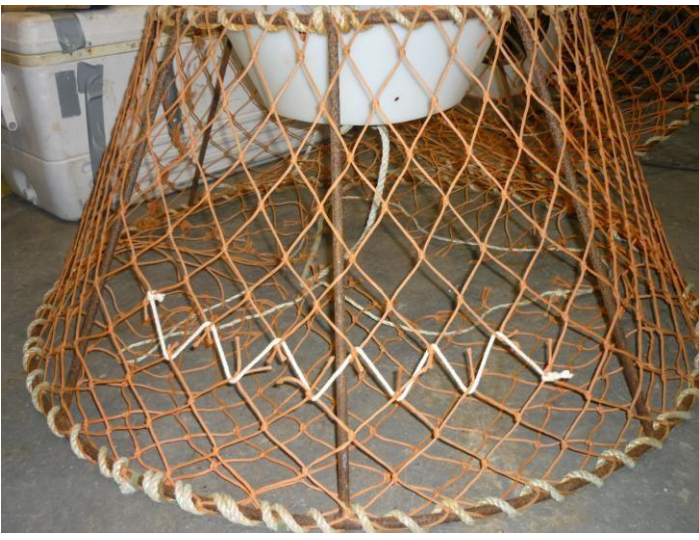
Assiliaq 2. Assiliami 2-mi takuneqarsinnaavoq, allunaasaq eqqortumik ikkunneqarsimasoq nigartanut affarnut aqqaneq-marlunnut ilanngunneqarluni.